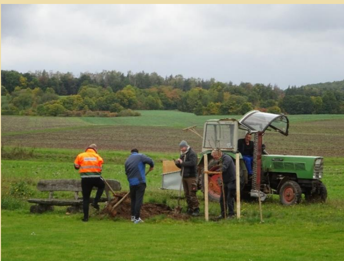
17.10. Pflanzaktion wird abgeschlossen