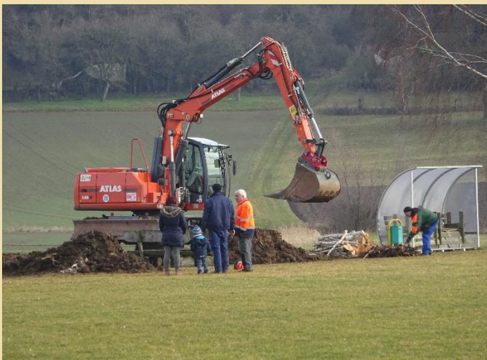
15.02. Pflanzlöcher werden ausgehoben