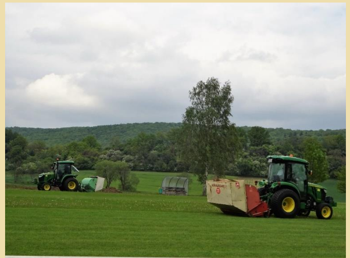
04.05. Sportplatz wird von der Firma Chr. Wendel vertikutiert