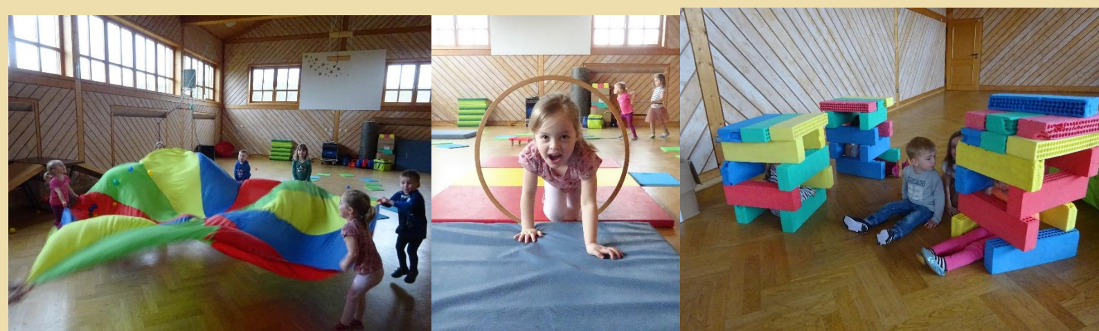
Kinderturnen in drei Gruppen