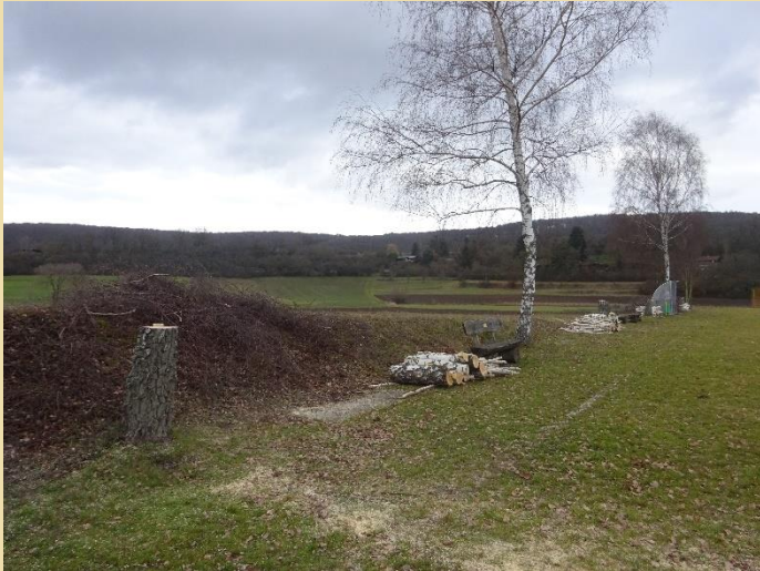
18.01. Birken werden gefällt